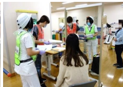
大地震を想定した大規模災害訓練の様子（広報誌 119 号より抜粋）

これまでに発行いたしました広報誌パティオのバックナンバーは右記の QR コードからご覧いただくことができます。