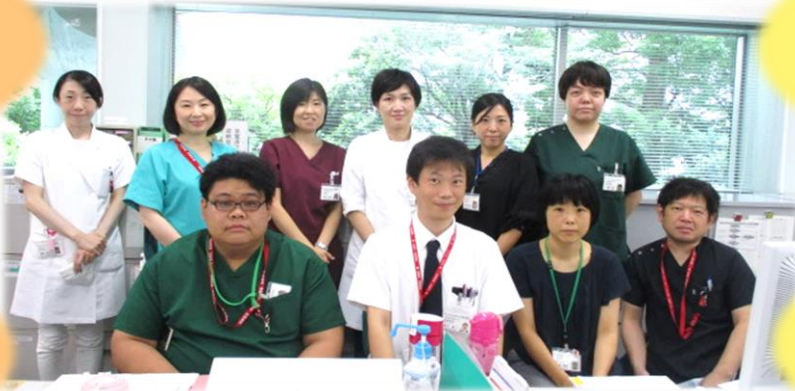
医療相談係の職員

普段、あまり意識されることはないかもしれませんが、同じ病気の患者さんであっても、その患者さんの周囲にある環境は全く異なります。